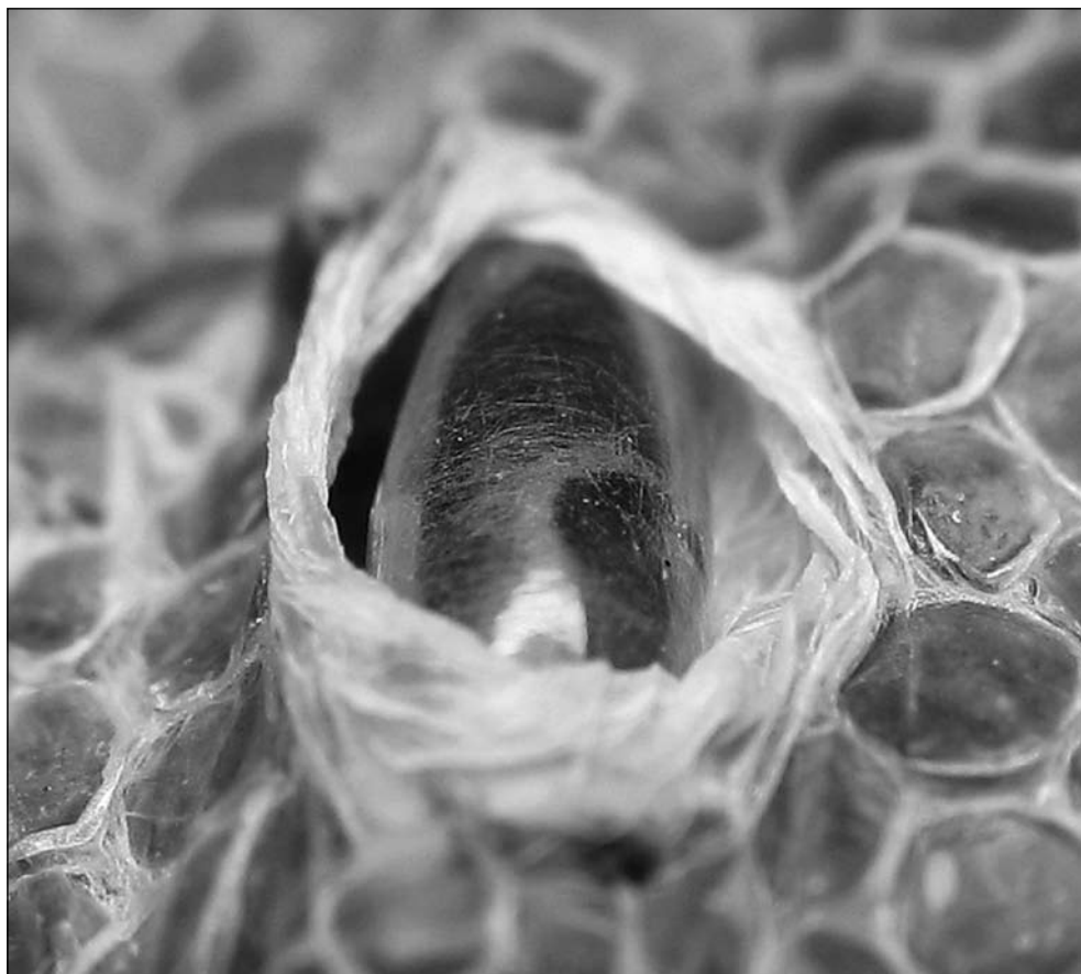
Foto 3. Deel van de vervelde opperhuid van de kop rond een oogkapje. Een deel van de instulping rond het oogkapje werd voor de foto weggeknipt om de krassen op de schub duidelijk zichtbaar te maken.

Boa constrictor do not shed their skin more often when they eat a lot and grow at a high rate as a result. Their shedding frequency does not change with age. Young boas consume much food and when they are able to