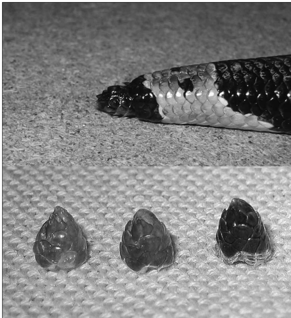
Foto 2. Zes keer werd de opperhuid van de staartpunt niet mee afgestroopt. Na verwijdering van de opperhuidjes (onderste foto: één, nog één, en een kapje van vier resten) bleef een achtergebleven staartpunt over (bovenste foto). Na verloop van tijd herstelde het.

Photo 2. The tip of the tail missed its moult six times. After removal of the epidermal remnants (lower picture: 1, 1 and a combination of 4 remnants) a reduced tail tip remained (upper picture) which regrew in time.