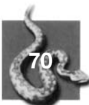
Photo 1. An epidermis in duplicate. At the end of the earlier shedding cycle the boa 'forgot' to slough. Afterwards large patches of the old skin peeled away lizard-like. All following moults were normal. The photograph shows the epidermis cut open showing the remnants of the 'forgotten' shed.