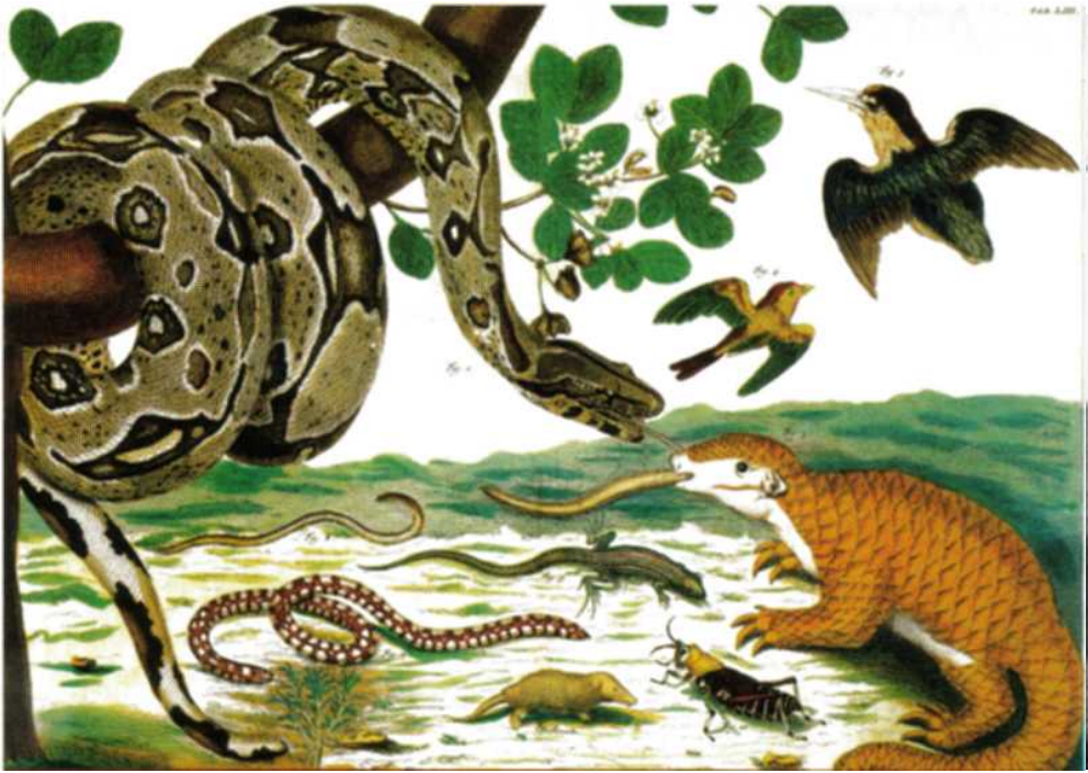
Een van de oudste afbeeldingen van een Boa constrictor . Ingekleurde gravure van Seba 1743. Met dank aan Klaus Bonny, Die Gattung Boa en KUS-Verlag.

One of the oldest pictures of a Boa constrictor . Hand coloured engraving from Seba, 1743. By courtesy of Klaus Bonny, 'Die Gattung Boa', KUS-Verlag, 2007, page 17